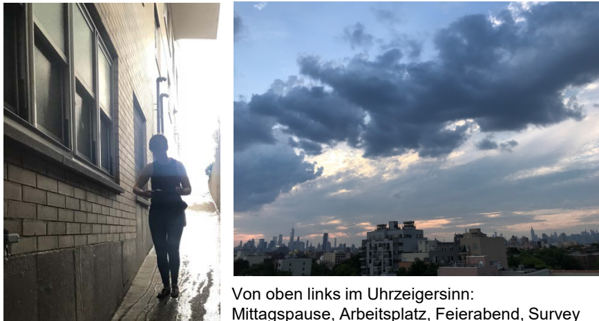
Von oben links im Uhrzeigersinn: Mittagspause, Arbeitsplatz, Feierabend, Survey

Als angehende Architektin ein Traum dort zu leben!