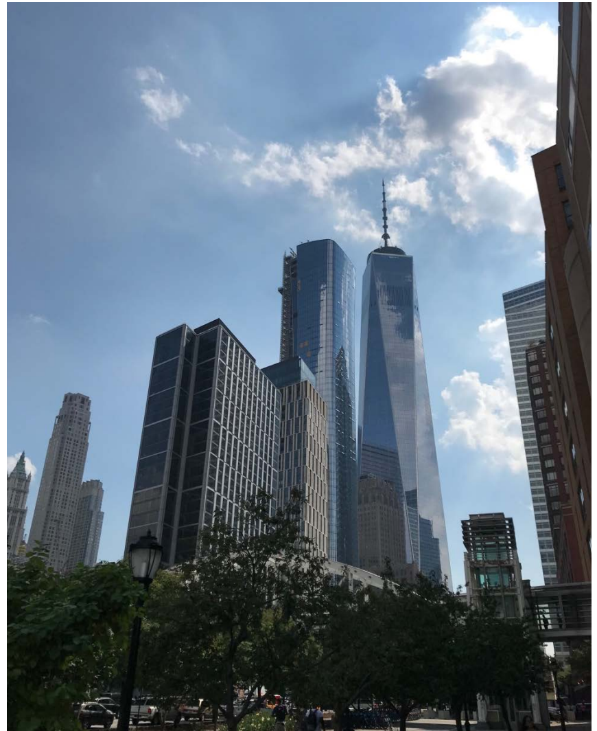
New York, USA